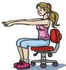
Extensão dos dedos e punhos (Abrir a palma da mão.)

CHAME A FAMÍLIA PARA FAZER JUNTOS – LEMBRANDO QUE VAMOS CONTAR ATÉ 20 CADA POSIÇÃO.