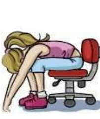
Flexão do tronco