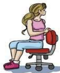
Rotação do tronco e do pescoço