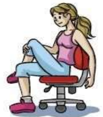
Adução e flexão da coxa