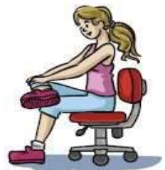
Abdução e rotação externa da coxa (Cruzar a perna.)