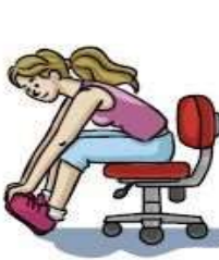
Flexão dorsal do pé