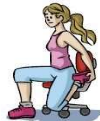
Flexão da perna e extensão da coxa