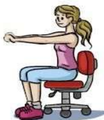
Flexão dos dedos (Fechar a mão.)